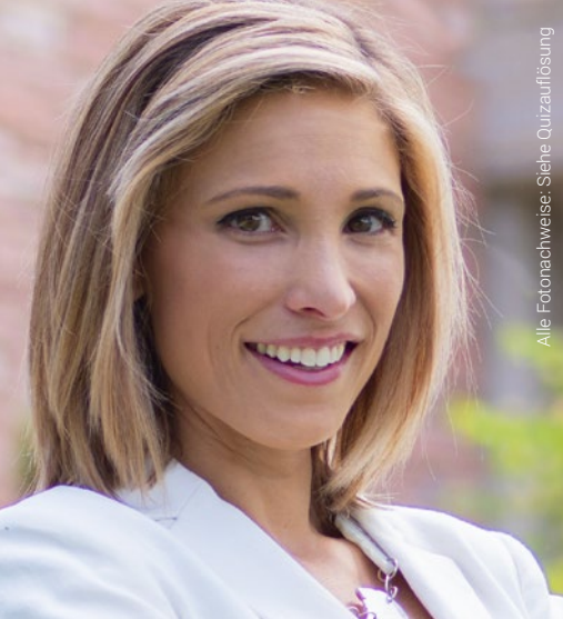
Alle Fotomachweise: Siehe Quizauffassung